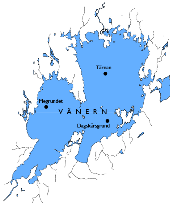
Figur 1. Bottendjur provtas på Vätterns djupbottnar i augusti varje år.

Undersökning av bottenfauna i Storvänern syftar till att kvalitativt och kvantitativt beskriva status, samt ev. förändringar i bottenfaunasamhällets sammansättning i sjöns djupaste delar. Artsammansättningen förändras vid miljöpåverkan, och resultaten kan därför användas för att bedöma sjöekosystemets samlade påverkan från luftföroreningar, utsläpp och markanvändning, samt andra ingrepp eller åtgärder inom avrinningsområdet. Undersökningstypen är speciellt lämplig för att bedöma status och förändringar i sjöars näringsnivå.