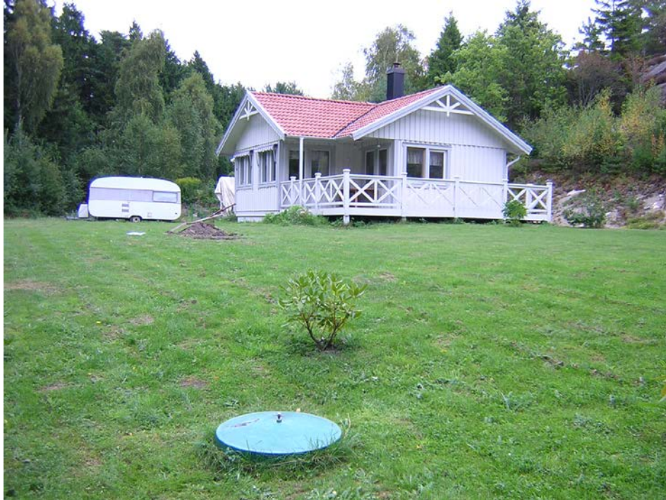
Enskild avloppsanläggning.

allmän avloppsanläggning. Naturligtvis under förutsättning att valda lösningar inte riskerar att medföra olägenheter för människors hälsa eller miljön. Små avloppsanläggningar medför alltid viss risk/påverkan varför individuella lösningar bör tillämpas restriktivt i större sammanhang.