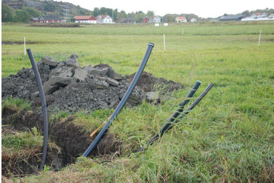
Ledningsdragningar inom gemensamhetsanläggning för bl a VA.

51). Det interna avlopps nätet inom till exempel gemensamhetsanläggningen får anses utgöra ett tillsynsobjekt (u-objekt) för den kommunala miljötillsynsmyndigheten. Tillsyn kan krävas och tillsynsavgift kan komma att tas ut.