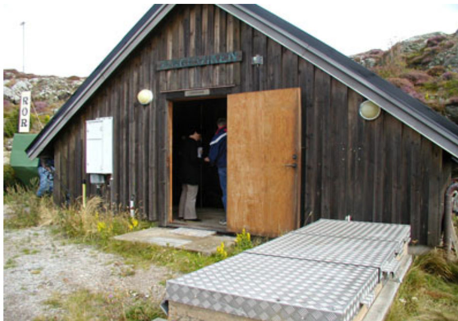
Gemensamt avloppsreningsverk för ca 500 pe.

Situationer kan tänkas uppstå när kommunalt ansvar föreligger men fastighetsägarna är eniga om att de vill lösa va-frågorna på egen hand genom att anlägga, äga och driva en gemensam anläggning. I ett sådant fall är det projektgruppens uppfattning att kommunens ansvar i princip kvarstår. Kommunen bör därför i ett tidigt skede ta ställning till om verksamhetsområde ska inrättas eller om man kan acceptera en gemensamhetsanläggning. En mycket viktig förutsättning för va-samverkan är att alla fastighetsägare är med samt att förmågan att samarbeta finns från början och kan förväntas bestå på lång sikt. Om denna i ett senare skede inte visar sig fungera, till exempel på grund av konflikter eller dålig skötsel och drift, kan enligt vår uppfattning kommunen bli skyldig att fullgöra sitt ansvar. Denna uppfattning får också stöd i praxis. För kommunen kan övertagandet av en anläggning man inte projekterat innebära tekniska problem.