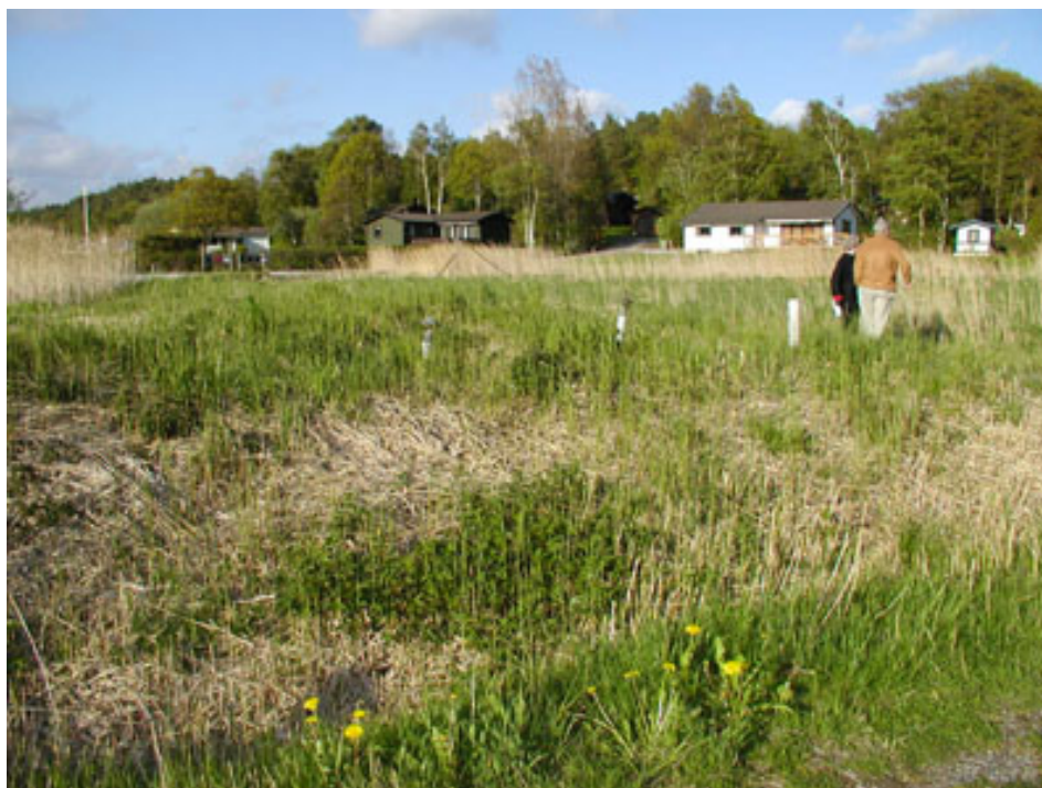
Platsbesök för granskning av dagvatten-, vatten- och spillvattensituationen i ett omvandlingsområde.