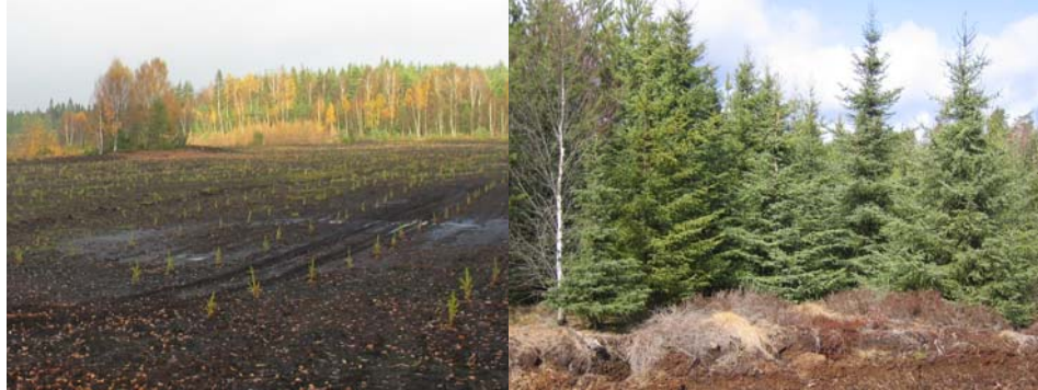
Bild 9. Granplantor på torvtäkt ett år respektive 17 år efter återföring av aska och plantering.

inte kvävehalten. Generellt sett ger torvaska en lägre ökning av metallhalter i marken jämfört med aska från ved. (Statens Energimyndighet och SCB, 2001)