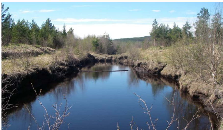
Bild 6. Exempel på sedimenteringsdamm med ytläns.

Rekommendationerna för rensning av dammar är olika. Vissa menar att sedimenteringsdammarna ska rensas då vattendjupet är mindre än 0,75 meter, andra när vattendjupet understiger 0,5 meter på någon punkt. Ytor för uppläggning av rensade sediment från dammarna bör finnas inom området och då inte i närheten av utloppsdiken eller andra vattendrag.