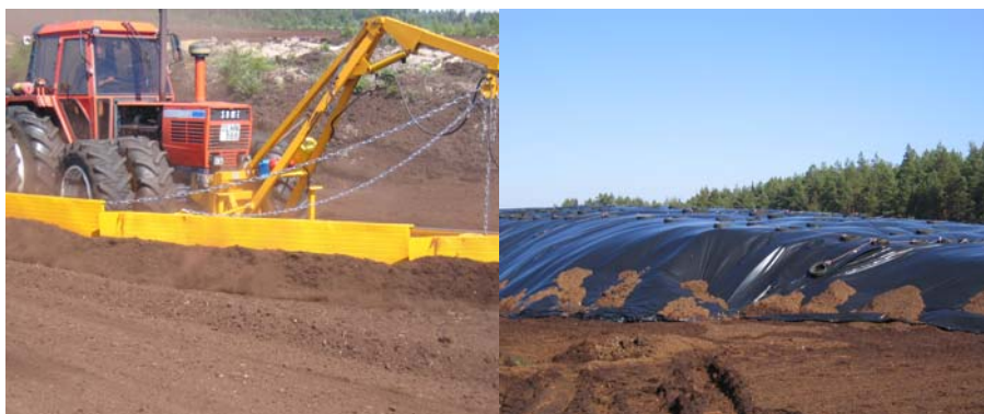
Bild 7. Strängläggning och stackning av frästörv.

Vad gäller mätning av damm refereras det ibland till en undersökning som gjordes vid Blackfärds mossen i Örebro län 1990, IVL-Rapport L90/229, Dammspridning från Blackfärds mossen, 20:e september 1990. Denna undersökning bedöms emellertid vara delvis bristfällig eftersom den genomförda stoftprovtagningen inte kunde korreleras till detaljerade uppgifter om i vilket område insamling av torv hade skett. Rapporten är numera också något föråldrad. I den mån man i nya ansökningar hänvisar till denna referens finns alltså anledning att ställa krav på nya, bättre undersökningar.