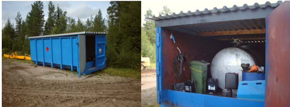
Bild 8. Så kallad miljöcontainer med bränslecistern, oljor och avfallsbehållare.