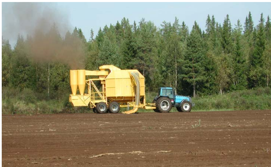
Bild 1. Upptag av strörtorv med sugvagn.

På mindre mossar används ofta sugvagnar för att suga upp och transportera den torra torven utan föregående strängläggning.