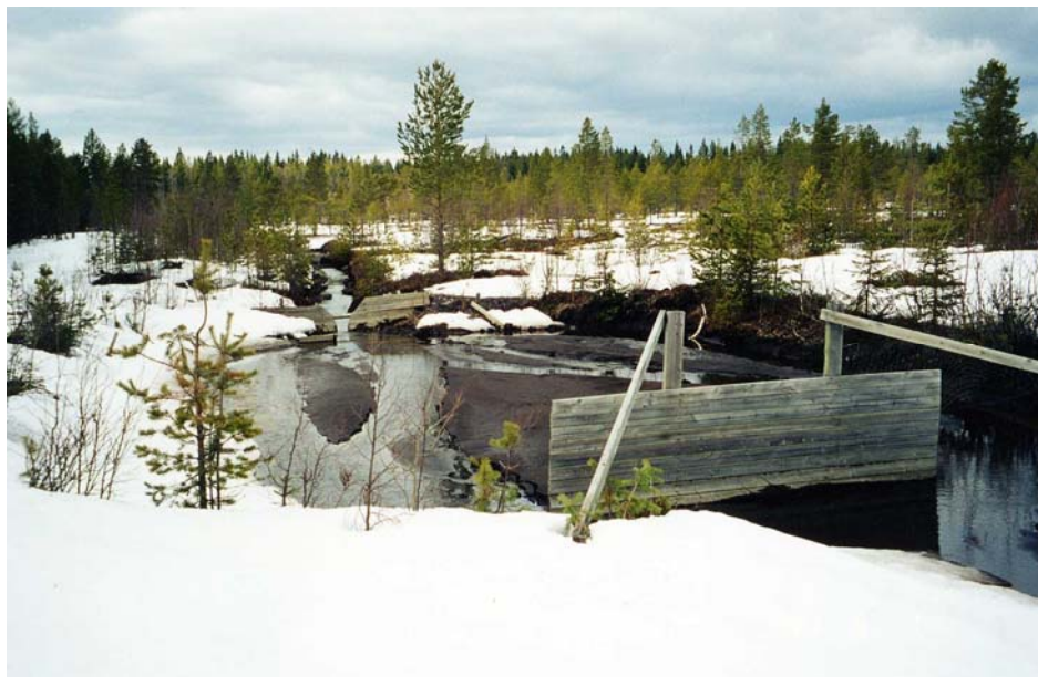
Bild 2. Exempel på dämpskärm av trä.

Dämpskärmar sätts upp i inloppet av en sedimenteringsdamm för att sprida vattenflödet och därigenom få ned vattenhastigheten i dammen. En dämpskärm kan vara utformad på många olika sätt och kan vara av väv, plast eller annat material. En dämpskärm av väv eller tyg kan även medverka till att filtrera det ingående vattnet. Nackdelen med dessa är dock att de snabbt sätts igen och lätt går sönder.