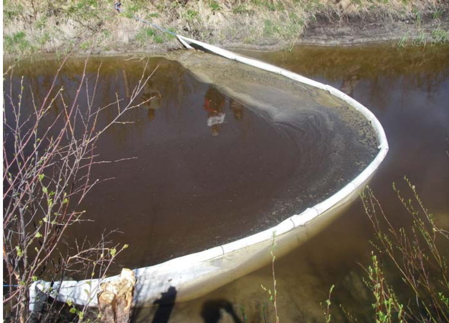
Bild 3. Ytläns med dämpskärm av textil.

sitter fast med ringar runt pålen. Pålen måste naturligtvis vara minst lika hög som diket/bassängen.