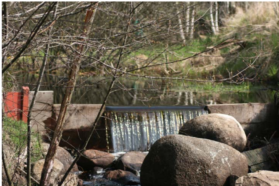
Bild 5. Ett horisontellt överfall i nederdel av en sedimenteringsbassäng.

I den nedre delen av ett dike eller damm kan ett överfall placeras. Ett enkelt överfall fås genom att en plåt som täcker hela dammens brädd sätts ner i dammen. Övre kanten på plåten ligger i höjd med normal/önskad vattennivå. Överfallet har till uppgift att dämpa hastigheten på utgående vatten samt bibehålla djupet i sedimenteringsdammen. Ett Thompsonöverfall är ett överfall med en v-formad öppning, där öppningens vinkel är känd. Detta används när man vill veta hur mycket vatten som rinner i till exempel ett dike. Genom att mäta avståndet från den v-formade spetsens underkant till vattennivån, får man ett mått på vattenflödet.