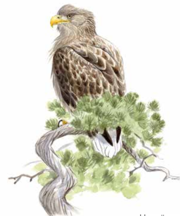
Havsörn Haliaeetus albicilla