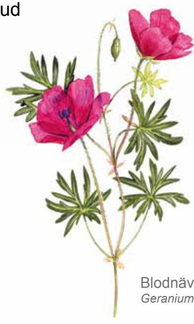
Blodnäva Geranium sanguineum