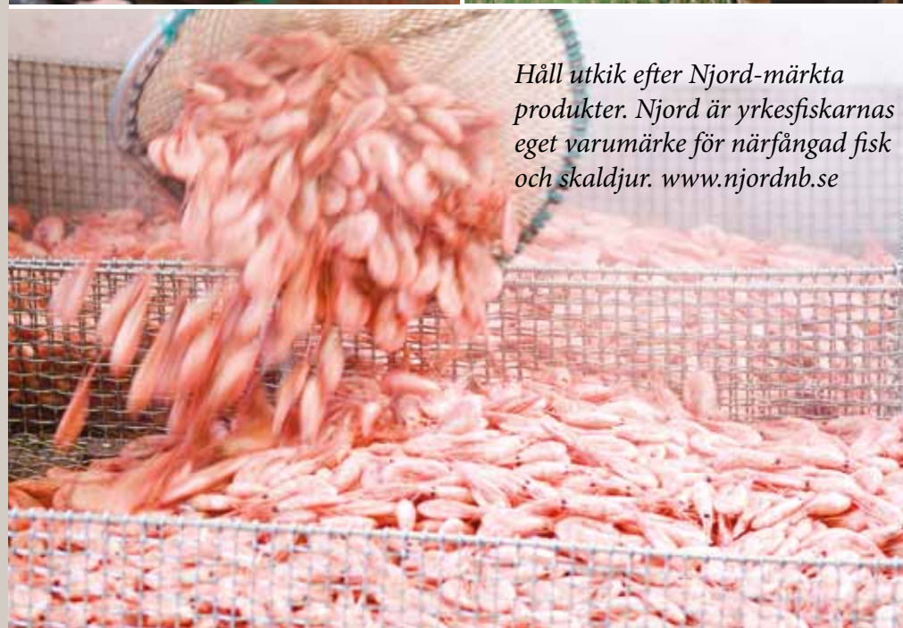
Håll utkik efter Njord-märkta produkter. Njord är yrkesfiskarnas eget varumärke för närfångad fisk och skaldjur. www.njordnb.se