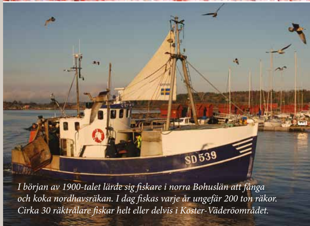
I början av 1900-talet lärde sig fiskare i norra Bohuslän att fånga och koka nordhavsräkan. I dag fiskas varje år ungefär 200 ton räkor. Cirka 30 räkträlare fiskar helt eller delvis i Koster-Väderöområdet.