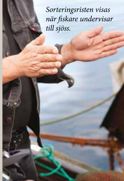
Sorteringsristen visas när fiskare undervisar till sjöss.

Överenskommelsen träffades år 2000 mellan fiskare, forskare, fiskets organisationer och myndigheter på olika nivåer. År 2015 togs beslut om kompletterande bestämmelser. Idag är elva mindre områden i den djupa fjorden skyddade från trålning. Det krävs också särskilda tillstånd för att få fiska efter räka i området. Mindre och lättare trålar ska användas, trålarna är också utrustade med rist så att mängden bifångad fisk minimeras. Kunskapsutbyte och utbildning lyfts fram i överenskommelsen. Flera kurser i marin ekologi (för fiskare) liksom kurser i yrkesfiske/fiskeriteknik (för forskare/tjänstemän) har ordnats.