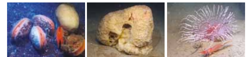
Havsbottnen i fjorden är full av säregna djur som kan skadas. Från vänster till höger syns limamusslor, svampdjur och en cylinderros.

Att fortsätta utveckla fiskeredskapen för ett skonsamt och selektivt fiske är viktigt. Arbetet för att ytterligare förbättra trålarna med sikte på ökad selektivitet och minskad påverkan på bottenarna går därför vidare. Utbildning och kunskapsutbyte mellan fiskare, myndigheter och forskare är även fortsatt en viktig del i samförvaltningen.