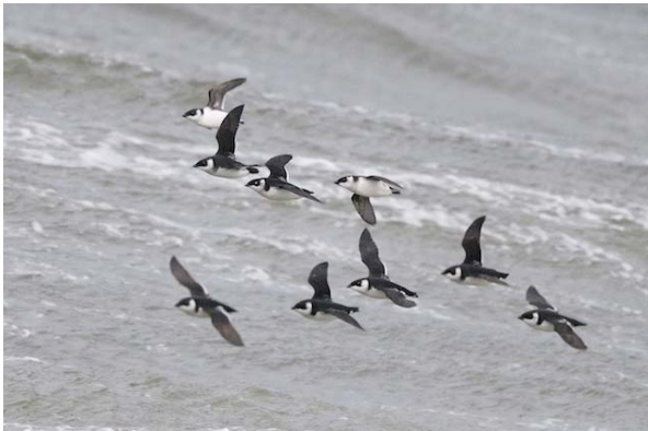
alkekung Alle alle