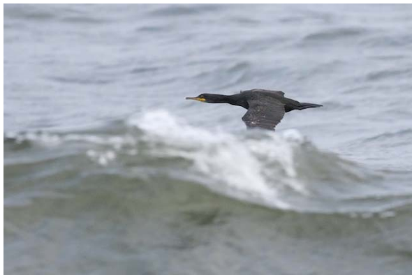
toppskarv Phalacrocorax aristotelis