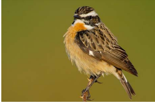
buskskätta Saxiola rubetra