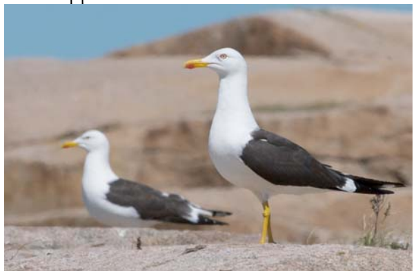
silltrut Larus fuscus