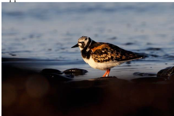
roskarl Arenaria interpres