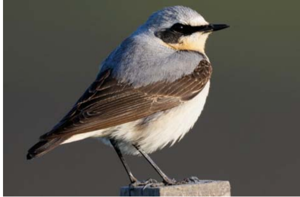
stenskvätta Oenanthe oenanthe