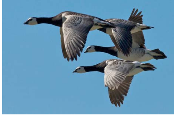
vitkindad gås Branta leucopsis