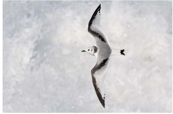
tretåig mås Rissa tridactyla