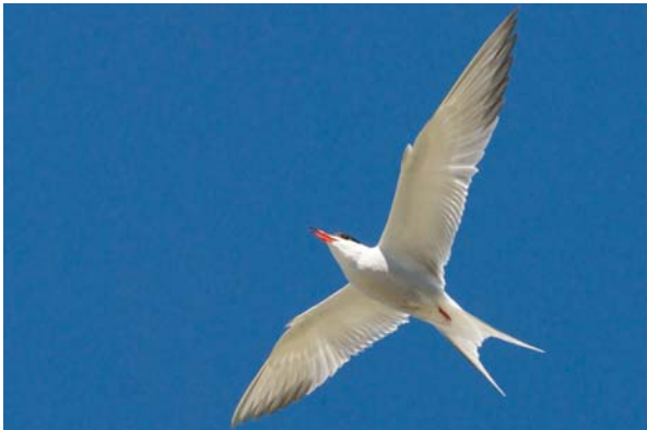
fisktärna Sterna hirundo