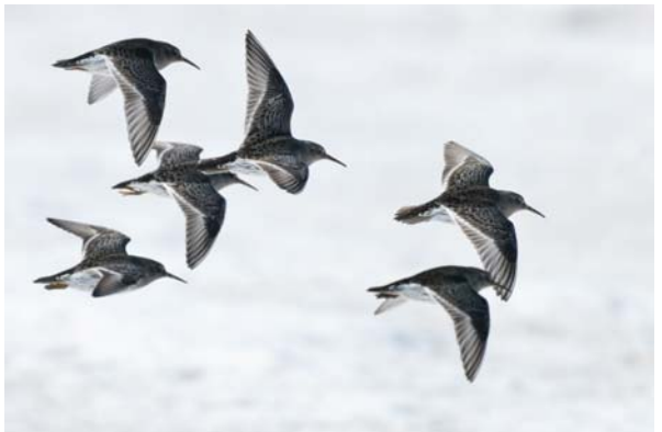
skärnsnäppa Calidris maritima