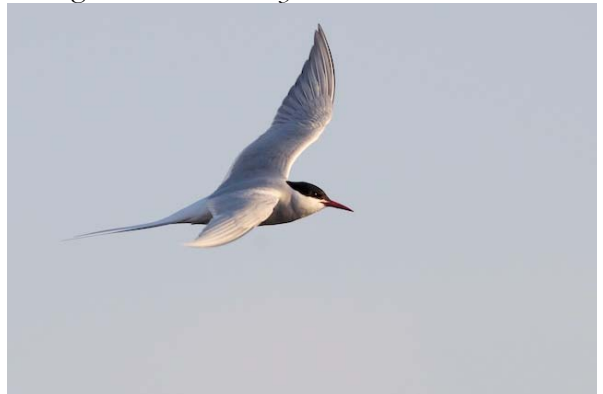
silvertärna Sterna paradisaea