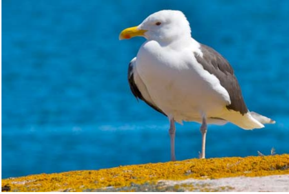
havstrut Larus marinus