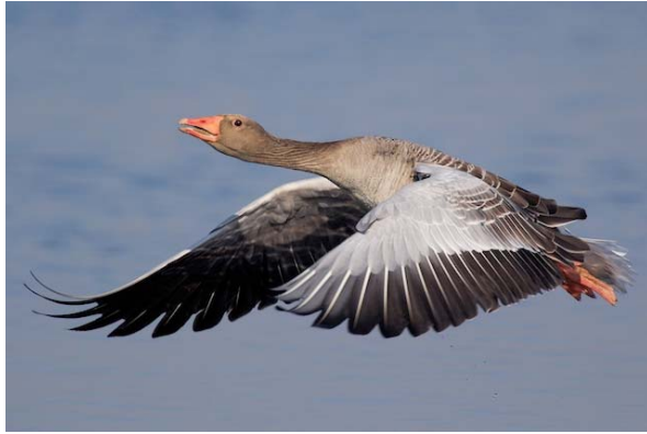
grågås Anser anser