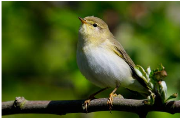
lövsångare Phylloscopus trochilus