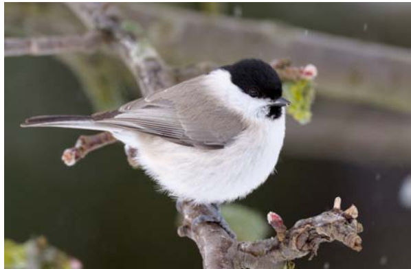
entita Parus palustris