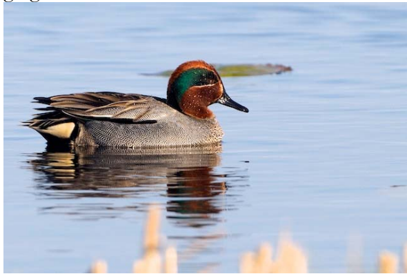
kricka Anas crecca