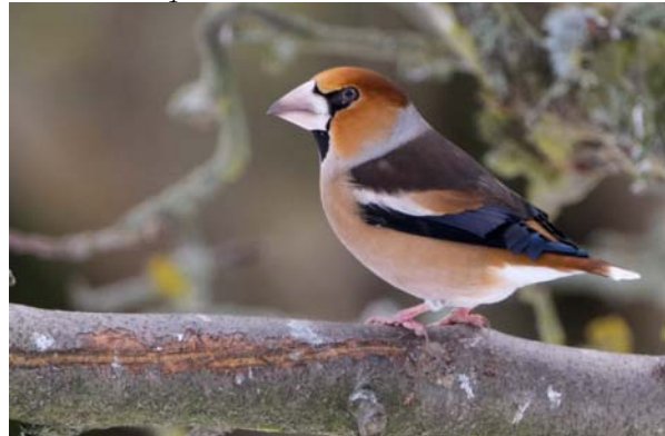
stenknäck Coccothraustes coccothraustes