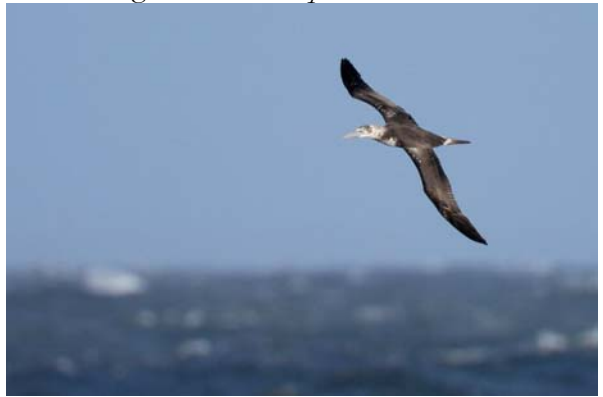
havssula Morus bassanus