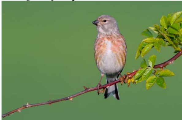
hämpling Carduelis cannibina