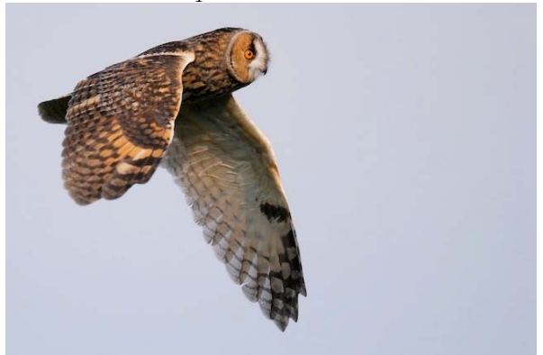
hornuggla Asio otus