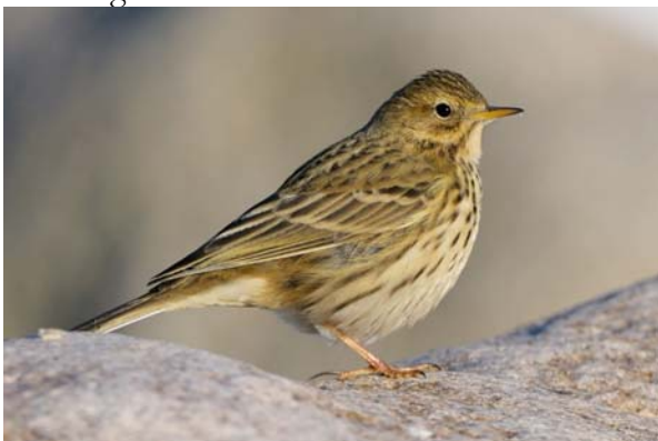
ängspiplärka Anthus pratensis