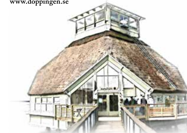
Tryck: Lenanders Grafiska AB Kalmar 2019

Café Doppingen: 0515-151 00 Facebook: "Café Doppingen" www.doppingen.se